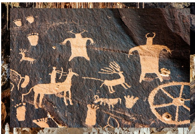
Рисунок 1.1.2 – Наскальные рисунки

Охотничьи народы, жившие в пещерах, украшали стены росписью еще 20 000 лет назад, но почти наверняка это были тотемные росписи, а не украшение, и никаких следов передвижной мебели не сохранилось.