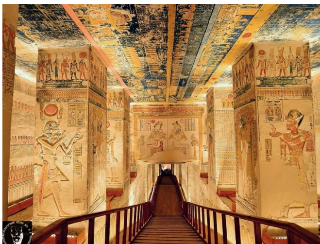
Рисунок 1.1.4 – Египетский стиль

Раскопки в древней Месопотамии и Египте позволяют предположить, что самый ранний эквивалент мебели состоял из платформ из кирпича, которые служили стульями, столами и кроватями, несомненно, покрытыми текстилем или шкурами животных. Есть также веские основания полагать, что стены были расписаны, а в случае более важных зданий - украшены фресками. Передвижная мебель впервые появилась только в самых важных резиденциях, таких как дворцы, и в общественных зданиях. Мебель довольно древняя, хотя известна большей частью только по настенным росписям, скульптуре и росписи на вазах. Некоторая мебель сохранилась из древнеегипетских гробниц примерно 3000 г. до н.э. в виде кроватей, стульев, столов и сундуков. Именно в такой мебели впервые появляется украшение — в ноге быка и льва, используемых в качестве опоры для мебели, особенно для кроватей. Именно с этой точки в далеком прошлом можно исторически проследить развитие дизайна интерьеров.