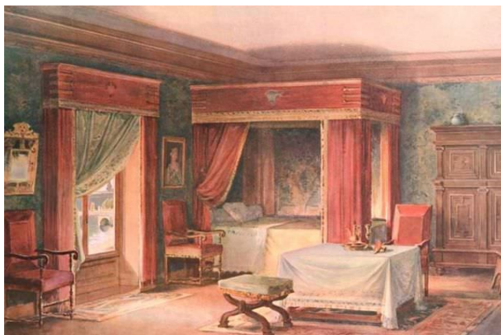
Рисунок 1.1.3 – Интерьер в древности

Хотя обычаи современных первобытных народов иногда проливают свет на историческое происхождение этих обычаев, сегодня в таких сообществах слишком мало искусства и декора, чтобы осветить зачатки внутреннего убранства. Никакие четкие последовательности стилей, подобные тем, которые произошли в Европе, не могут быть идентифицированы, за исключением народов, которые вряд ли можно считать примитивными, таких как прежние цивилизации Южной Америки или бенинская культура Африки. Тем не менее даже самые бедные и самые первобытные народы посвящают некоторое время производству произведений, доставляющих им удовольствие, и эти произведения часто употребляются для украшения интерьеров. Примитивная живопись часто состоит из серии абстрактных узоров, например, на керамике индейцев пуэбло. Мебель, например деревянные табуретки, обычно имеет орнаментальную резьбу. Корзинные изделия, деревянные сосуды и глиняная посуда украшены абстрактными геометрическими узорами, при этом правилом является соблюдение симметрии. Поскольку большинство этих узоров, особенно те, которые можно найти в плетении и текстиле, не имеют сходства с естественными формами, они, вероятно, возникли из-за природы методов, используемых при изготовлении рассматриваемых предметов.