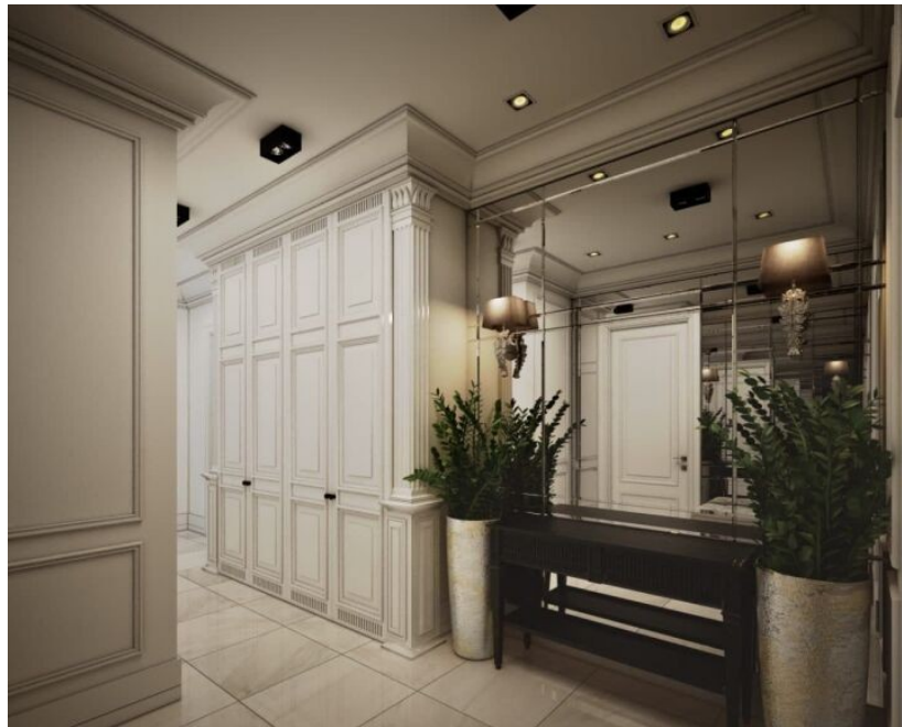
Рисунок 1.3.3 – Современный интерьер

Использовать можно любые цвета, однако доминируют черные, белые и серые тона. Они привлекают ощущением чистоты и простора, а также своей практичностью и универсальностью.