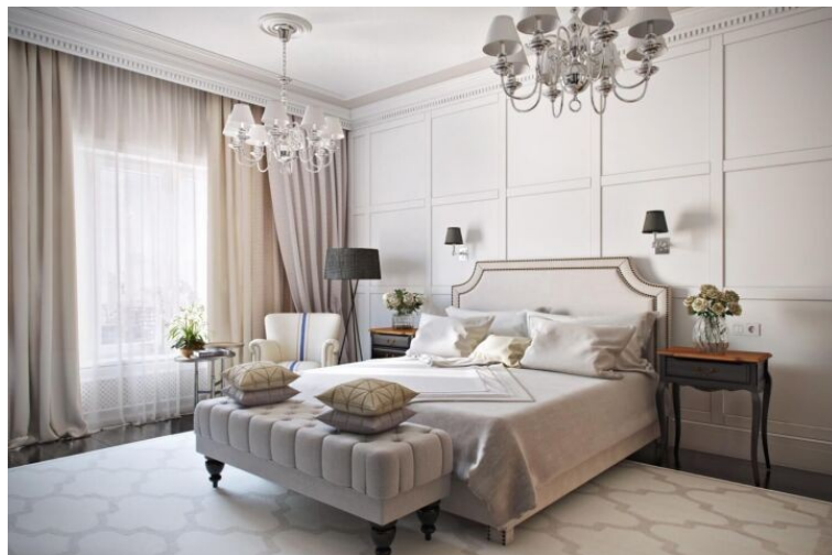
Рисунок 1.3.2 – Современный интерьер

Цветовая гамма чаще всего нейтральна и монохромна. Но также используются один-два ярких акцента. Важно знать, что современный интерьер не переносит вычурности.