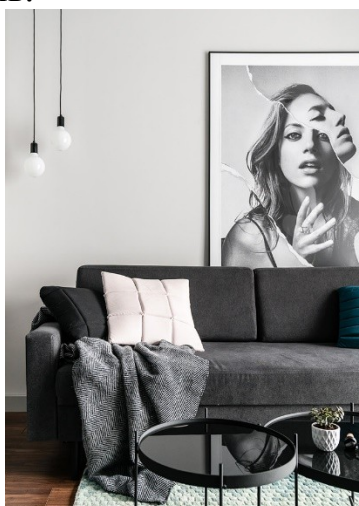
Рисунок 1.2.4 – Текстиль в интерьере

Текстиль добавляет текстуру и придает дополнительное измерение и тепло пространству. Драпировка, постельное белье, подушки и коврики из различных тканей, таких как лен, шерсть и хлопок, — это лишь несколько примеров того, как вы можете добавить тепла и комфорта в комнату, сохраняя при этом минималистский стиль.