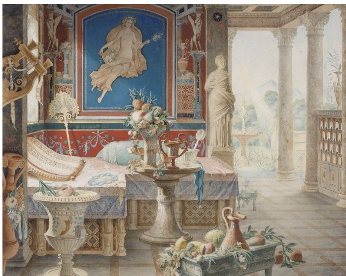
Рисунок 1.1.4 – Интерьер в стиле Древнего Рима