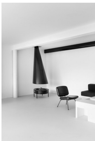
Рисунок 1.2.3 – Монохром в интерьере

Монохроматическая цветовая схема, состоящая из белого, бежевого и серого цветов, типична для пространств с минималистским дизайном.