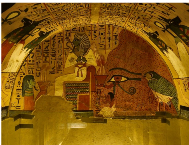
Рисунок 1.1.4 – Настенные рисунки в Египте