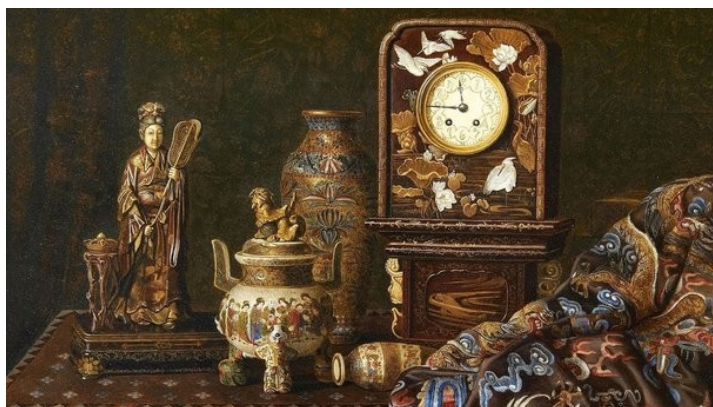
Рисунок 1.1.1 – Антиквариат в интерьере

Искусство дизайна интерьера охватывает все неподвижные и подвижные декоративные предметы, которые составляют неотъемлемую часть внутренней части любого человеческого жилья. Важно помнить, что многое из того, что сегодня считается искусством и выставляется в галереях и музеях, изначально использовалось для оформления интерьеров. Картины обычно заказывались по размеру и часто по сюжету от художника, который часто практиковал другие виды искусства, включая дизайн мебели и декорирование. Скульпторы по камню или бронзе часто были ювелирами, которые делали различные декоративные изделия из металла. У более важных художников были студии с помощниками и учениками, и они часто подписывали совместную работу. Многие архитекторы также проектировали интерьеры, в том числе аксессуары — мебель, керамику, фарфор, серебро, ковры и гобелены. Картины часто принимали форму кабинетных картин, обрамленных для подвешивания на стене в определенном положении, например, над дверью. Фрески были написаны на самые разные темы; в период стиля барокко 17 века фрески иногда раскрашивали, чтобы они выглядели как продолжение самого интерьера, делая его более просторным. Зеркала использовались с той же целью увеличения пространства в интерьере.