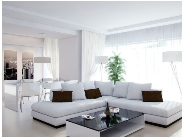
Рисунок 1.3.1 – Современный интерьер

В современном мире можно сочетать разные стилевые направления. Обладая хорошей насмотренностью и опытом, можно соблюсти баланс, сочетая элементы нео-классицизма и элементы лофта.