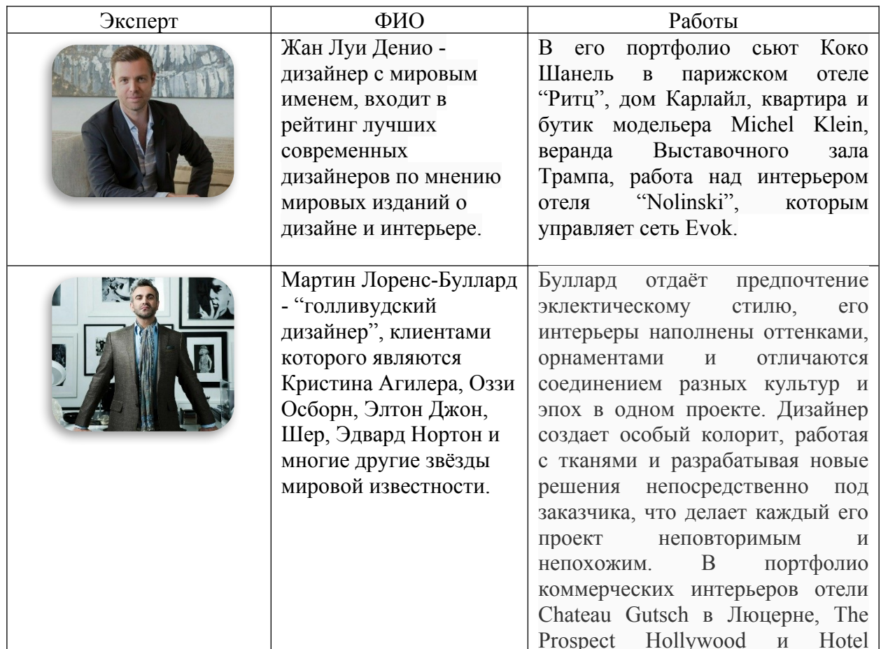
Таблица 1.1.1 – мировые дизайнеры

Использовать можно любые цвета, однако доминируют черные, белые и серые тона. Они привлекают ощущением чистоты и простора, а также своей практичностью и универсальностью.